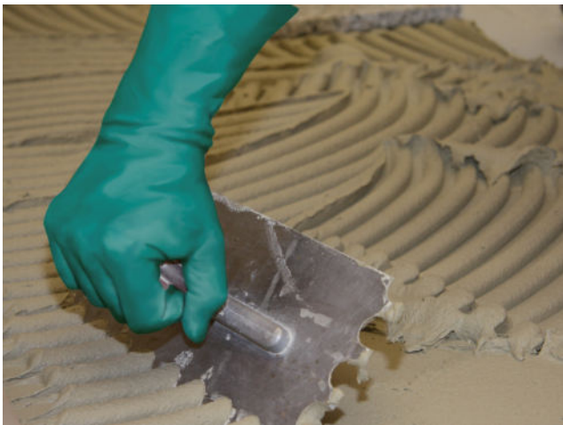
Aufziehen des Sopro FKM XL in Mittelbettkonsistenz mit einer Mittelbettkelle auf die vorbereitete Kontaktschicht.