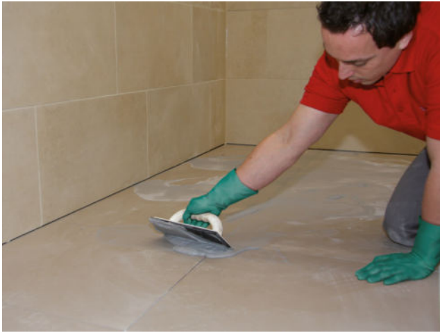
Verfugung der Fläche mit einer Sopro Fugenmasse (z.B. Sopro DF 10 DesignFuge Flex, Sopro Brillant Perlfuge)