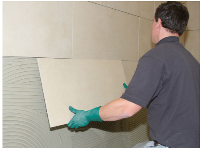
Großformatiges Feinsteinzeug einlegen und ausrichten. Fugennetz vor der Erhärtung auskratzen.