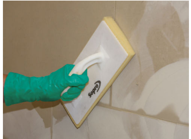
Abwaschen des Fliesenbelages nach ausreichender Standzeit der eingefugten Sopro Fugenmasse.