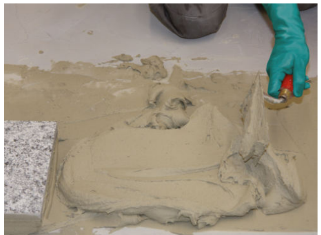
Sopro FKMXL ist für höhere Mörtelschichtstärken bis 10 mm auch mit der Kelle verarbeitbar.