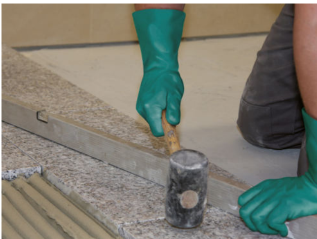
Einklopfen der Natursteinplatte und Überprüfung auf Ebenmäßigkeit.