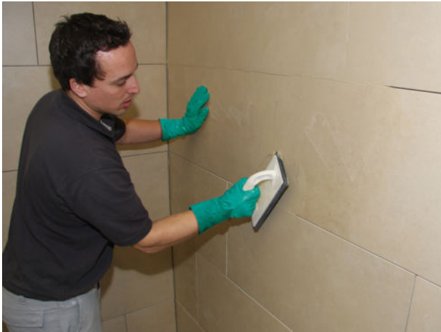
Verfugung der Fläche mit einer Sopro Fugenmasse (z.B. Sopro DF 10 DesignFuge Flex, Sopro Brillant Perlfuge)