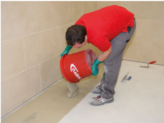
Ausgießen des FKM XL in Fließbettkonsistenz auf den vorbereiteten Untergrund.