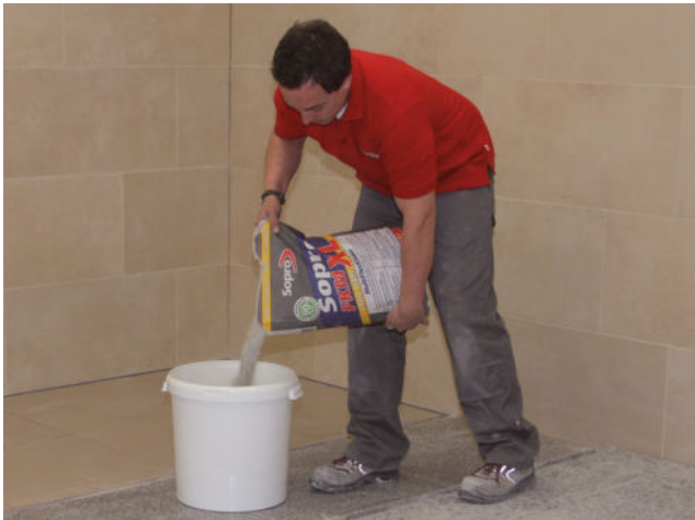
1.1 FKM XL MultiFlexKleber eXtra Light