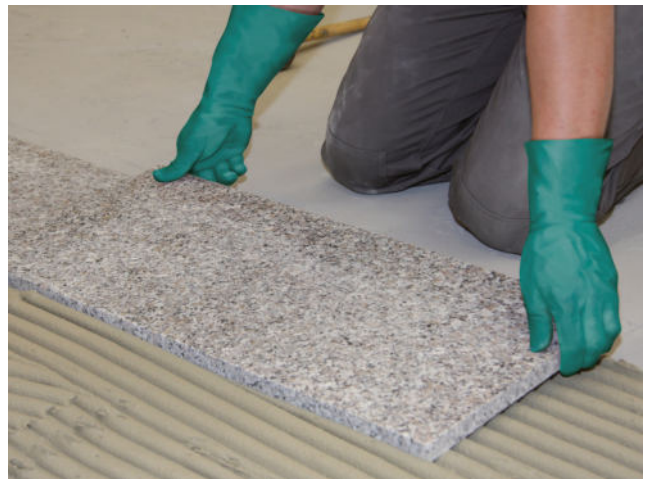
Natursteinplatte einlegen und ausrichten. Fugennetz vor der Erhärtung auskratzen.