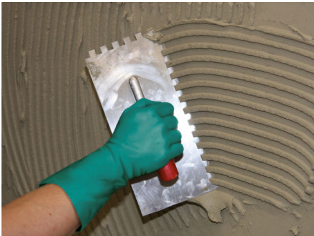
Aufziehen des Kammbettes in Wandkonsistenz auf die vorbereitete Kontaktschicht.