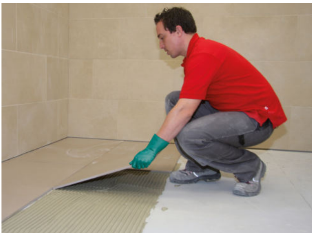
Großformatiges Feinsteinzeug einlegen und ausrichten. Fugennetz