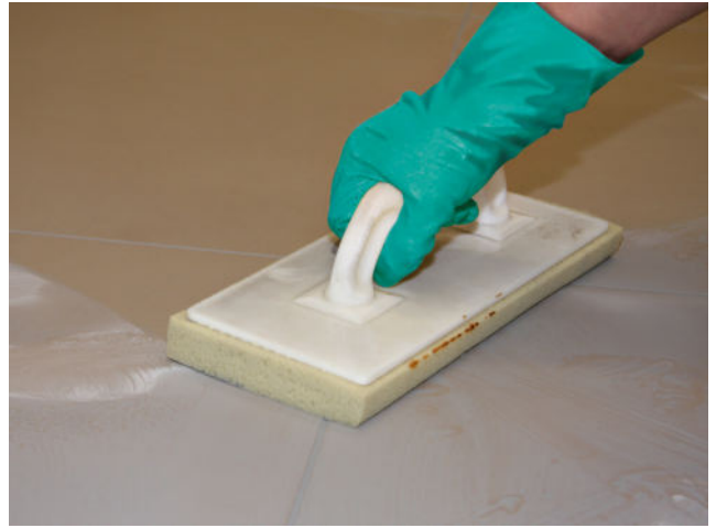
Abwaschen des Fliesenbelages nach ausreichender Standzeit der eingefugten Sopro Fugenmasse.